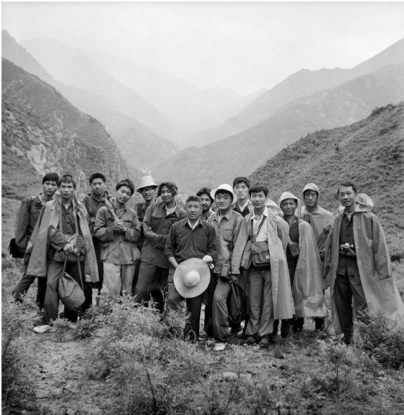
1979年6月，“星期五沙龙”成员在北京延庆海坨山

第二个富于意义的现象是非官方摄影社团的出现。成员达30余人的“星期五沙龙”是其中较早的一个，于1976年冬就已在北京开始活动。