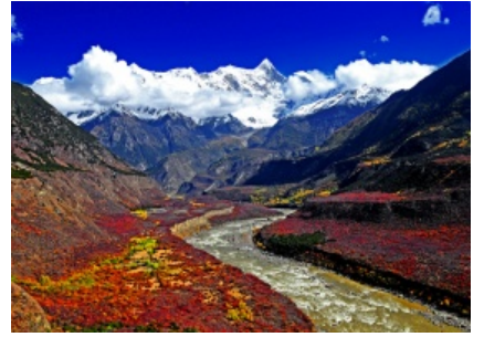
雪域金秋醉美林芝：海拔3000米上激情船

令人欣喜的是，秋天来了。这个季节，是人们最喜欢出门郊游远行的季节，而秋季在西藏却有更特殊的韵味，提起西藏的秋天，人们口中只有一个名字林芝。懂西藏的人，秋天